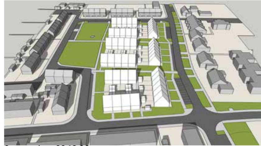
September 22 16:00