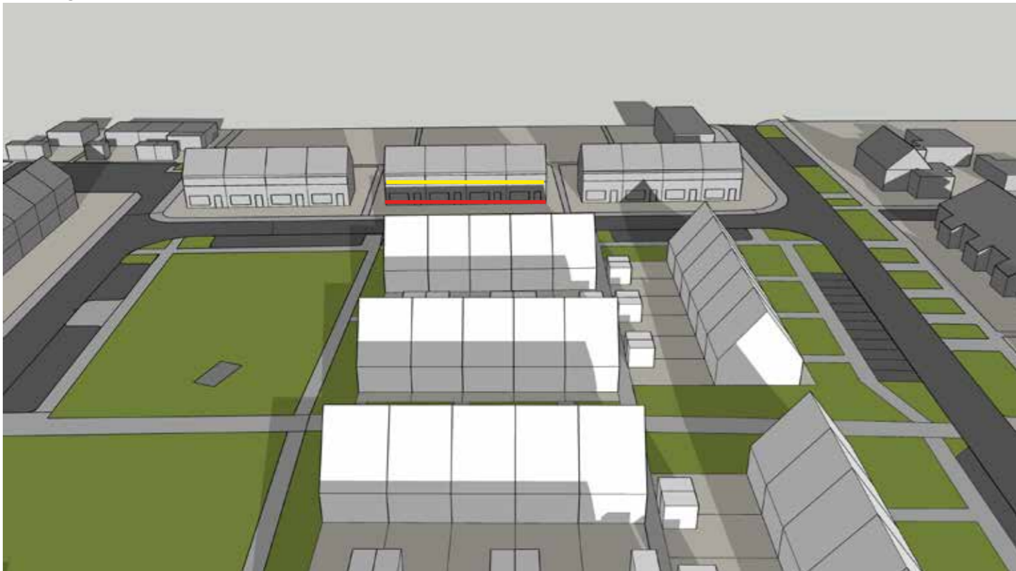
Nieuw model b (rooilijn -3,8m)

— Schaduw nieuw stedenbouwkundig plan — Schaduw huidige bebouwing