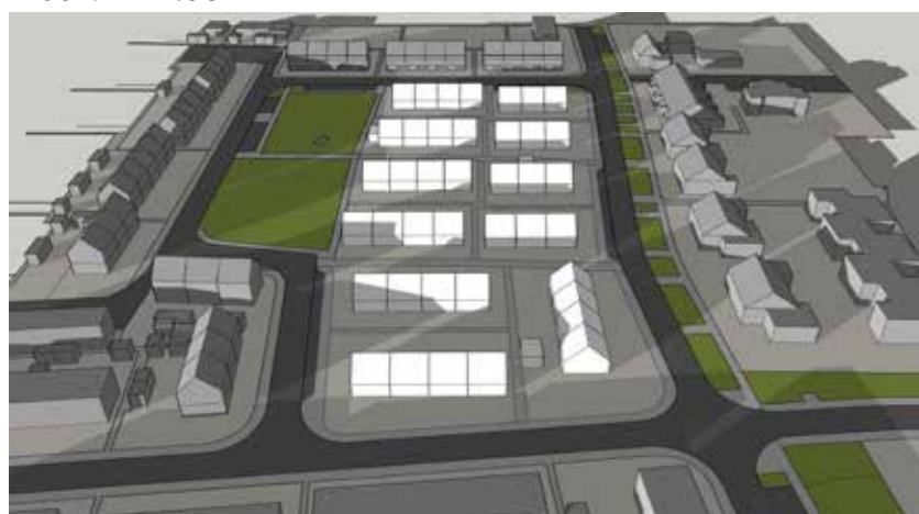
Maart 21 18:00