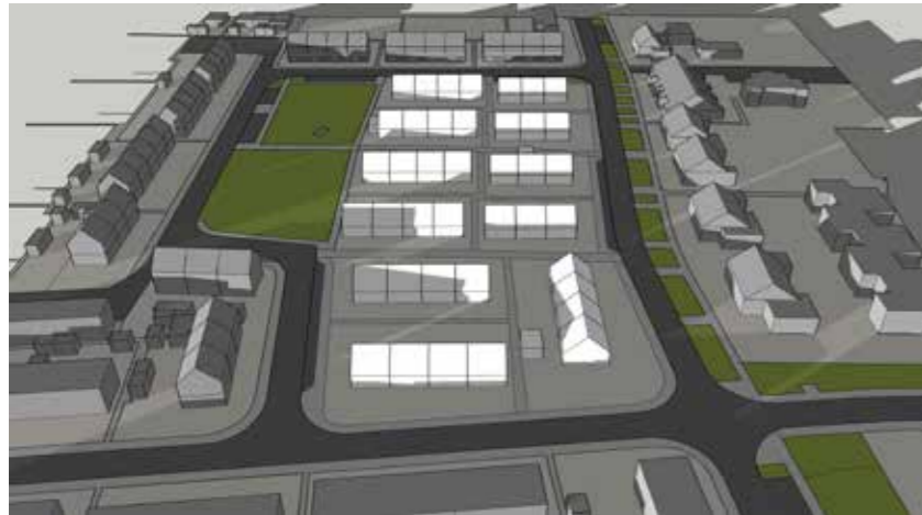
September 22 19:00