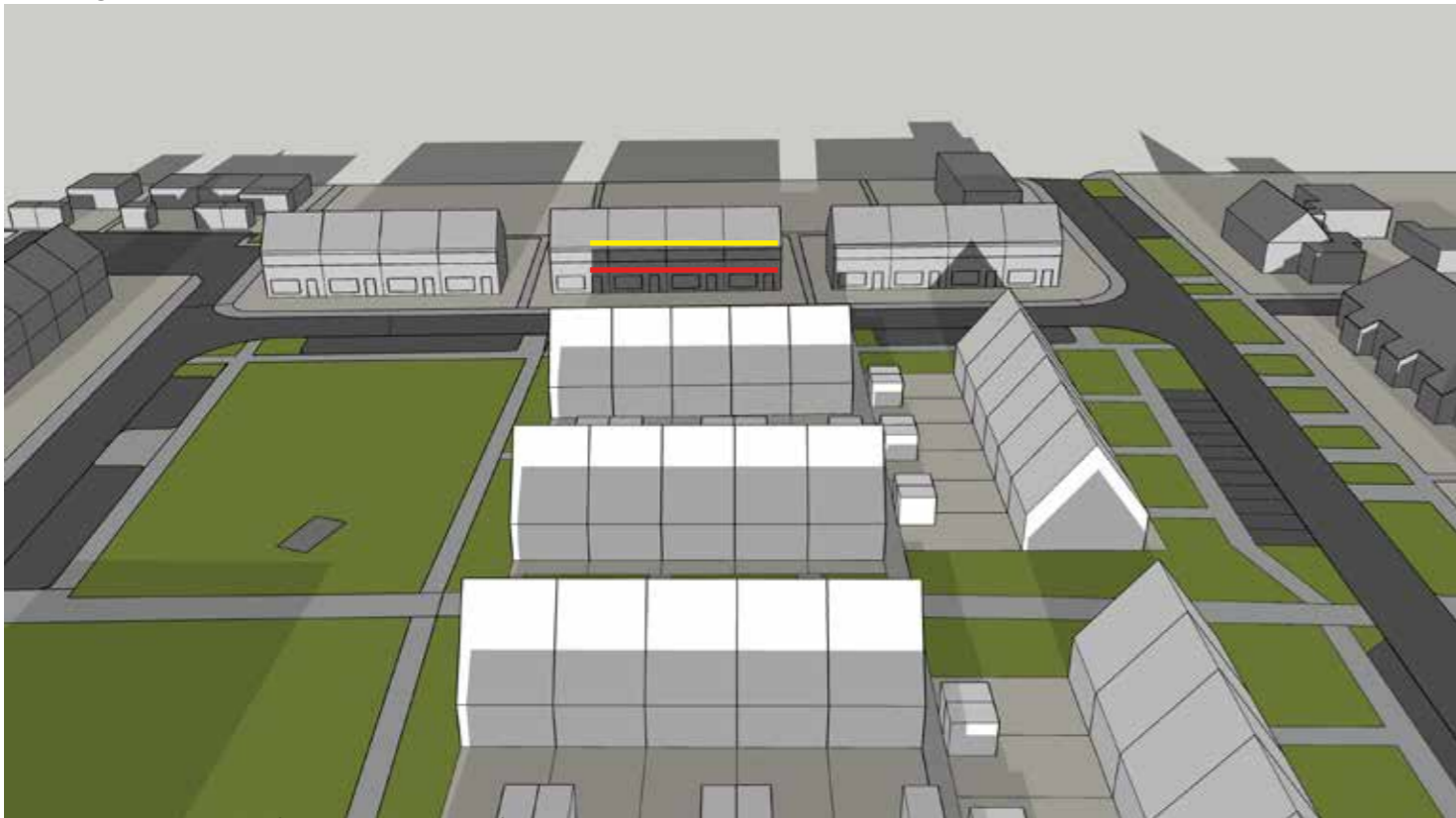
Nieuw model b (rooilijn -3,8m)

— Schaduw nieuw stedenbouwkundig plan — Schaduw huidige bebouwing