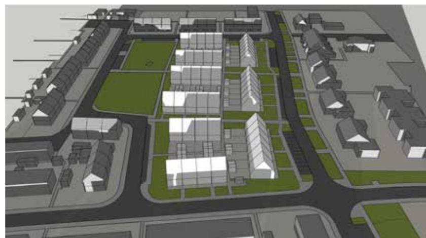
December 21 16:00

Blok N2 krijgt eerder schaduw Blok N3 overtrekkende schaduw