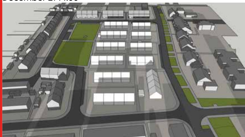
December 21 15:00