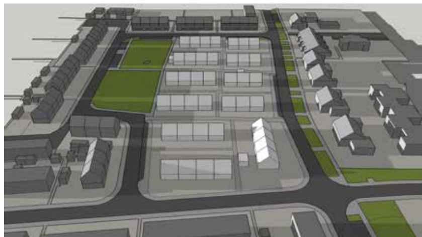
Juni 21 21:00