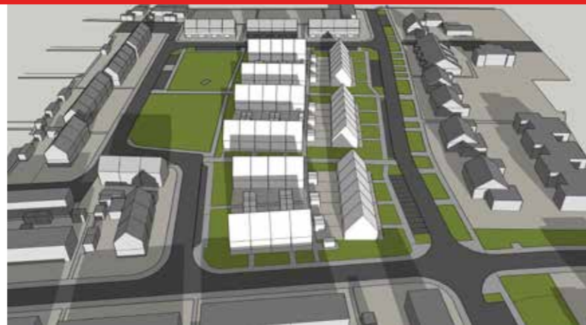
December 21 14:00