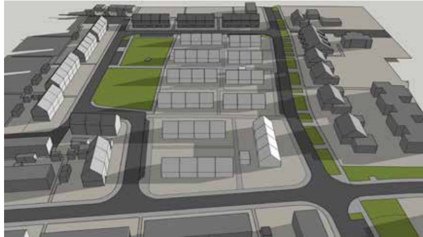
Maart 21 08:00