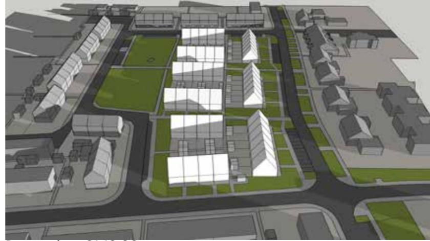
December 21 10:00

Blok N1 krijgt iets meer schaduw in de ochtend