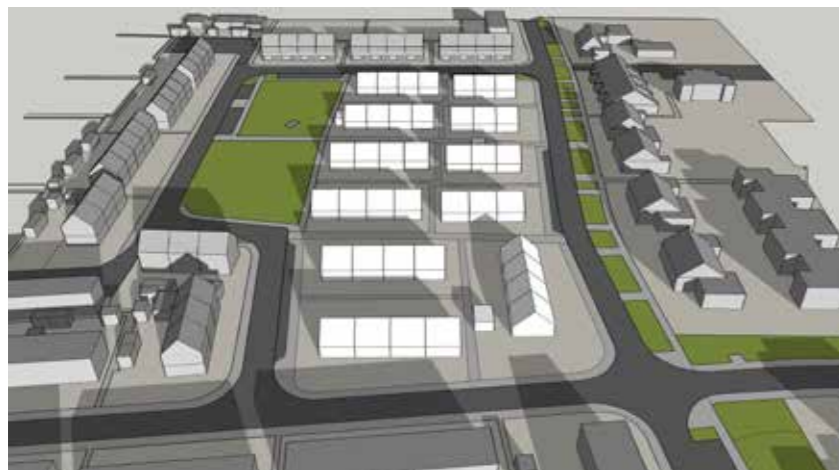
December 21 13:00