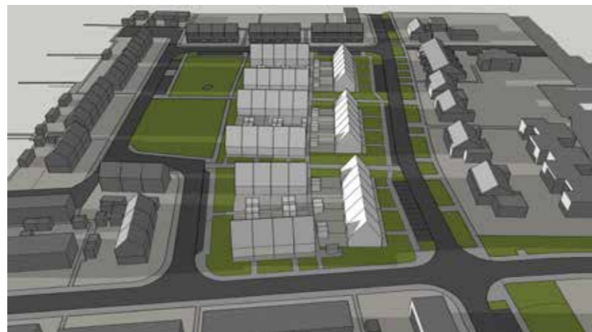
Juni 21 21:00

Blok O1-5 krijgen in de nieuwe situatie iets meer schaduw