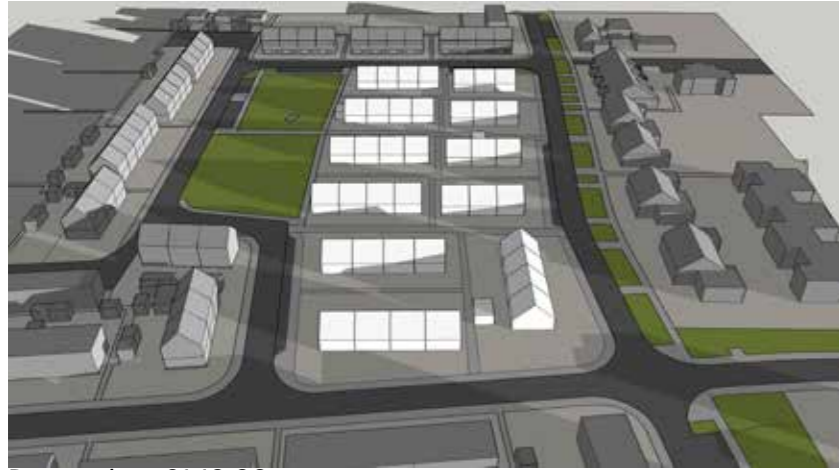
December 21 10:00

Ca. 20 minuten meer schaduw op gevel en dak