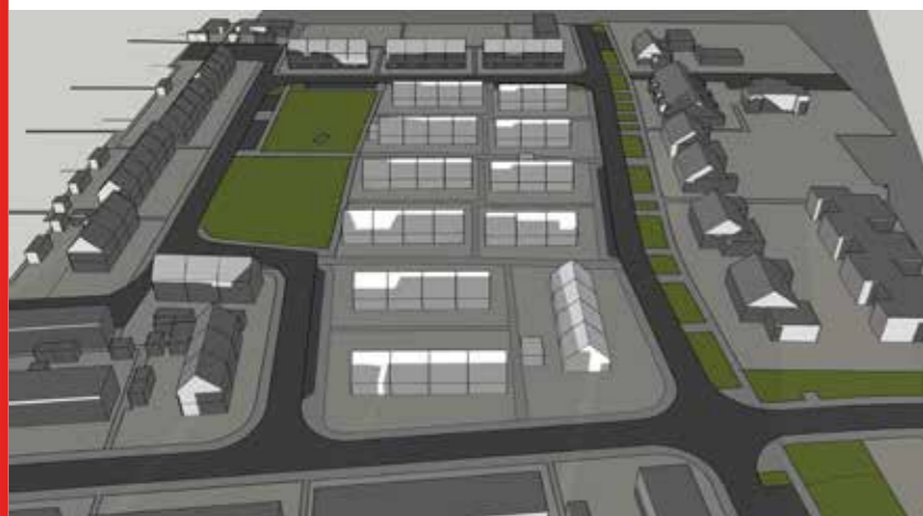
December 21 16:00

Blok N2 krijgt eerder schaduw Blok N3 overtrekkende schaduw