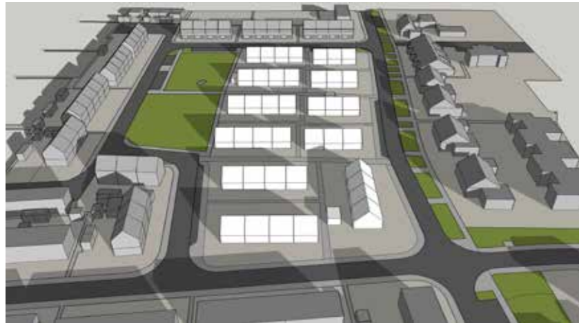
December 21 12:00