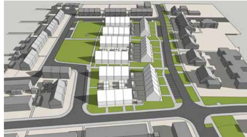
Maart 21 10:00