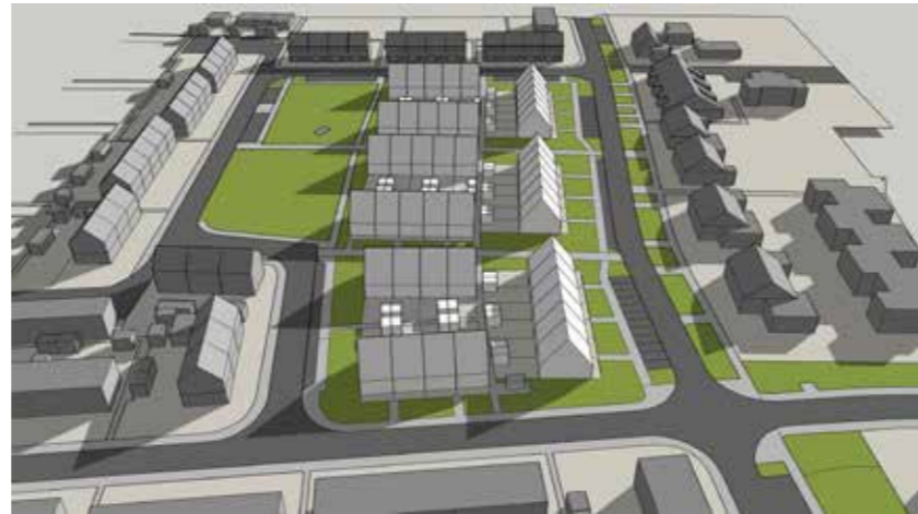
Juni 21 08:00