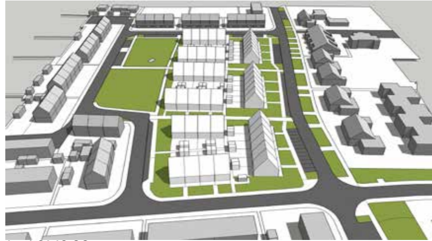
Juni 21 12:00