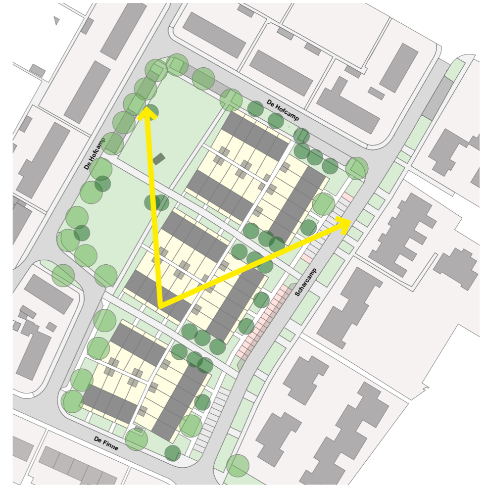
zichtveld 3d beelden zonnestudie