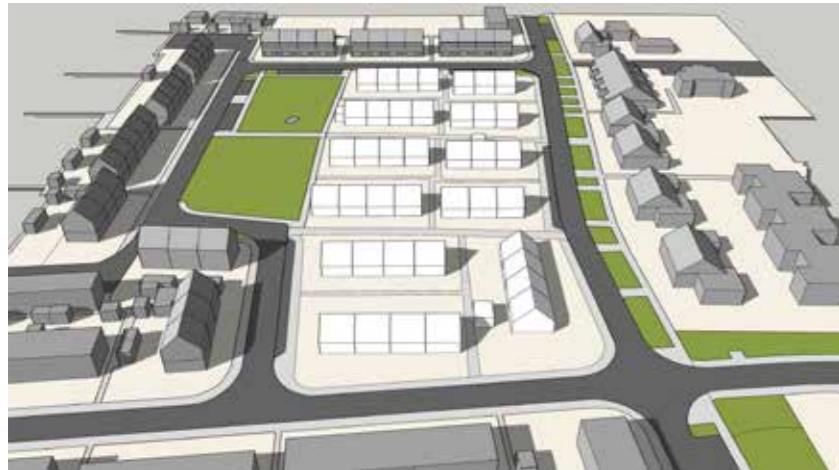
Juni 21 18:00