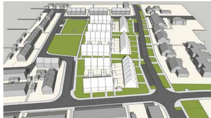
Maart 21 14:00