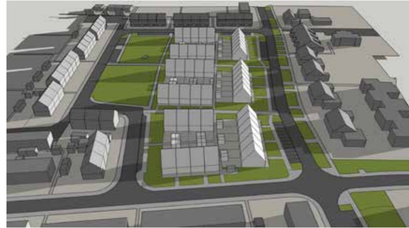
Maart 21 08:00

Blok W1 krijgt in de morgen een beetje schaduw