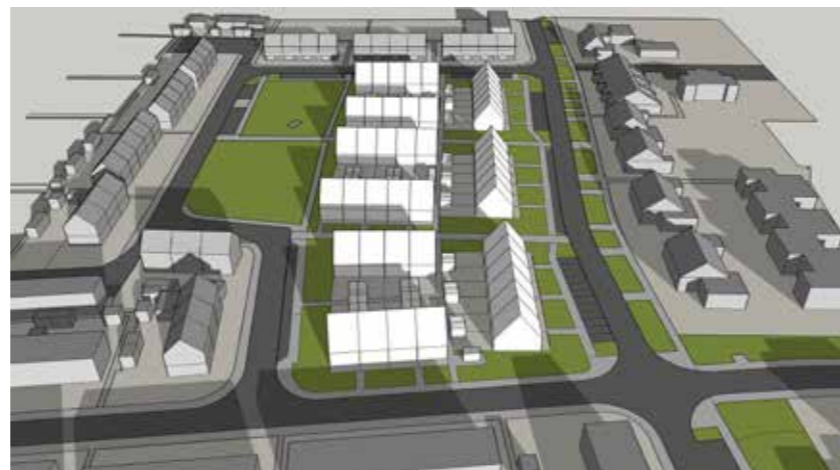
December 21 13:00