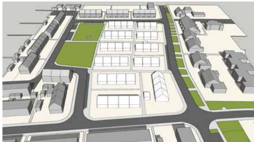
Maart 21 14:00