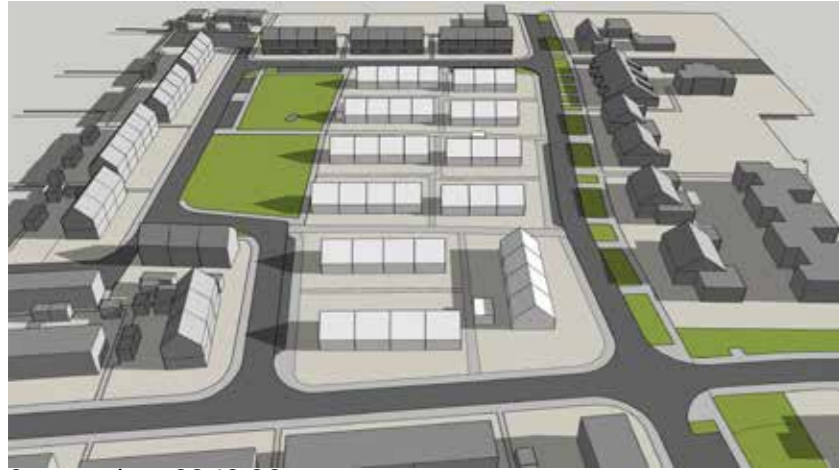
September 22 10:00

Ca. 30 min. meer schaduw op blok W1 (voornamelijke zuidelijke woning)