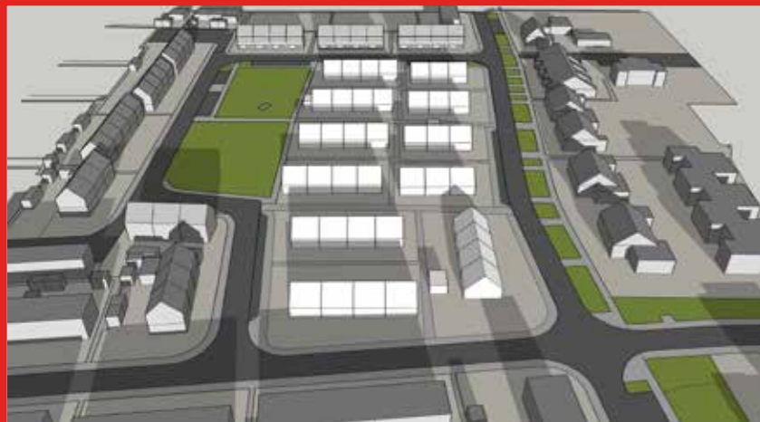
December 21 14:00