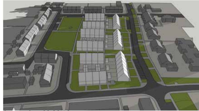
September 22 08:00

Blok W1 krijgt in de morgen een beetje schaduw