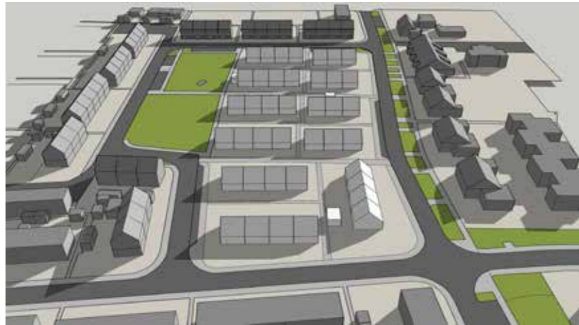
Juni 21 08:00