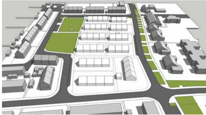
Juni 21 12:00