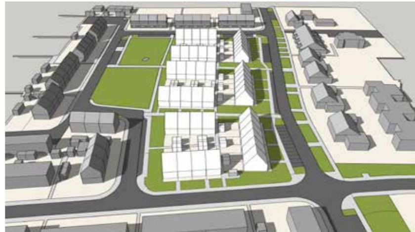
Juni 21 18:00