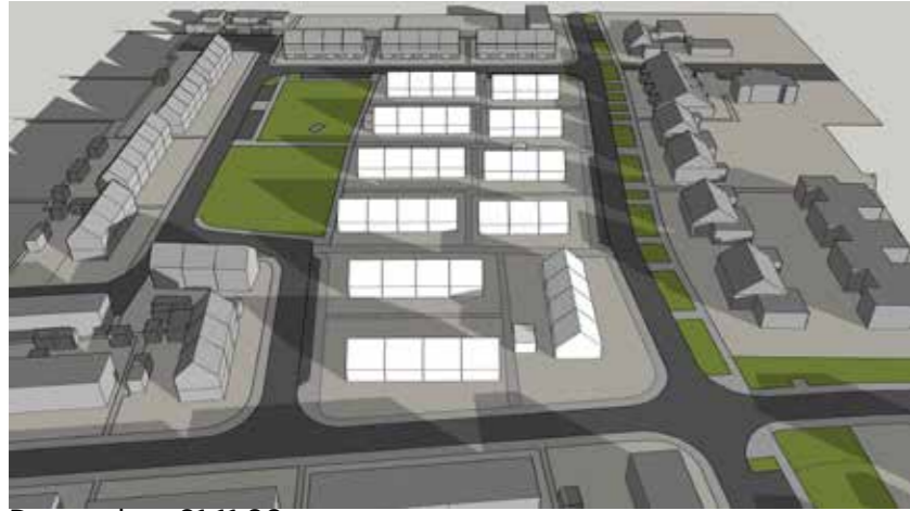
December 21 11:00

Overtrekkende schaduw tot 12:40 op de begane grond.