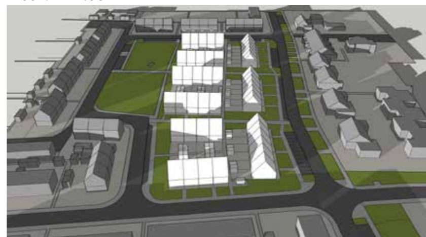
Maart 21 18:00

Blok O1-5 krijgen in de nieuwe situatie iets meer schaduw