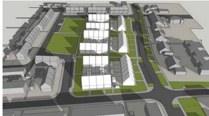
December 21 12:00