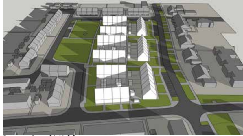
December 21 11:00