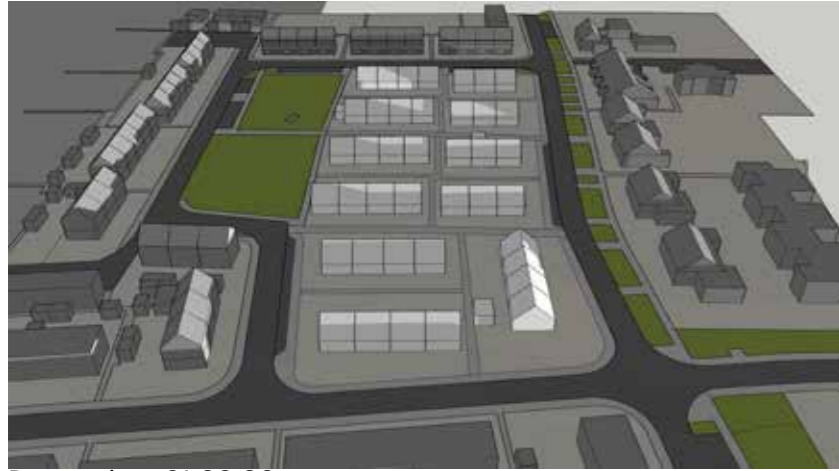
December 21 09:00