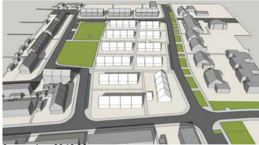
September 22 16:00