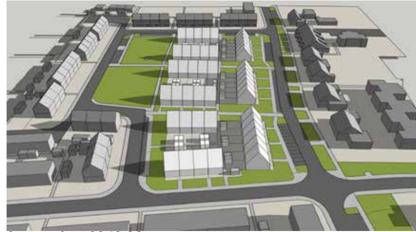
September 22 10:00