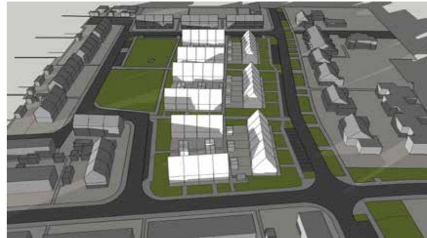
September 22 19:00

Blok O1-5 krijgen in de nieuwe situatie iets meer schaduw