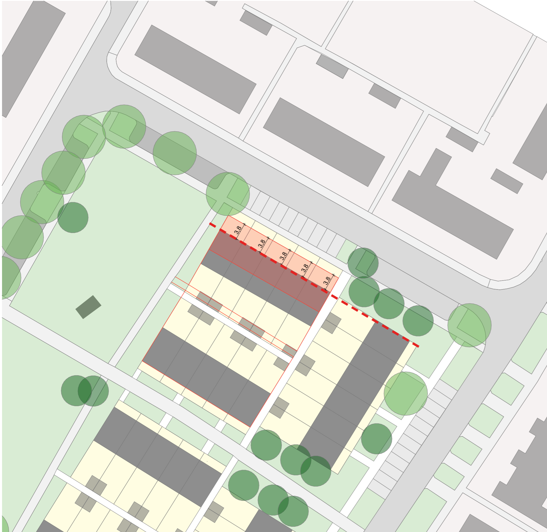
De noordelijke rooilijn 3,8m terug gelegd (op de rooilijn van woningblok aan de Scharcamp)